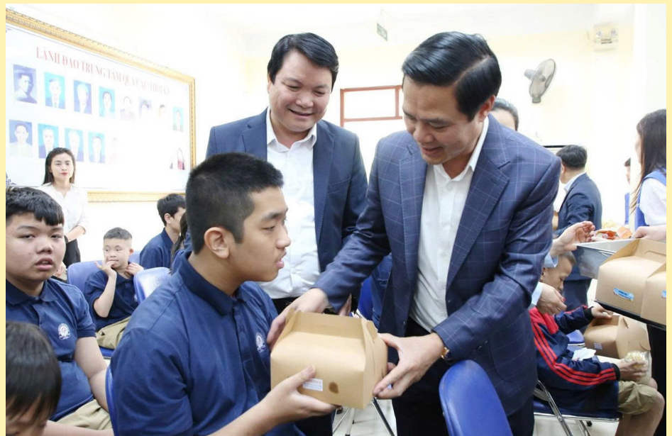
Đồng chí Lê Xuân Lợi, Ủy viên BTV Tỉnh ủy, Ủy viên BTV Đảng ủy, Phó Chủ tịch UBND tỉnh thăm và tặng quà tại Trung tâm Giáo dục chuyên biệt và Bảo trợ xã hội tỉnh Bắc Ninh.