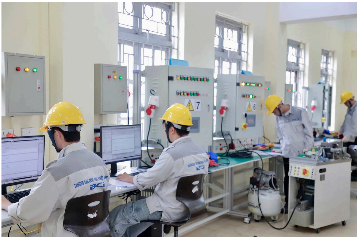
Sinh viên Trường cao đẳng Công nghiệp Bắc Ninh luyện kỹ năng nghề tại xưởng thực hành của Trường

Trong bối cảnh toàn cầu hóa và cuộc Cách mạng công nghiệp lần thứ tư phát triển mạnh mẽ, nguồn nhân lực chất lượng cao, đặc biệt trong các lĩnh vực công nghệ cao, công nghệ bán dẫn và công nghệ số ngày càng giữ vai trò then chốt đối với sự phát triển của mỗi địa phương. Đây không chỉ là yếu tố quyết định năng lực cạnh tranh, mà còn là điều kiện quan trọng để thu hút đầu tư, tham gia sâu vào chuỗi giá trị toàn cầu. Quán triệt quan điểm của Đảng xác định phát triển nguồn nhân lực là một trong những khâu đột phá chiến lược, tỉnh đã ban