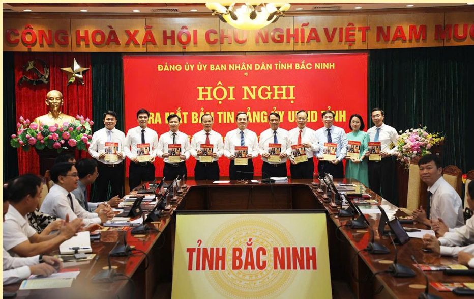
Các đồng chí Thường trực Đảng ủy và thành viên Ban biên tập Bản tin Đảng ủy UBND tỉnh trong ngày ra mắt Bản tin số 1/2026.