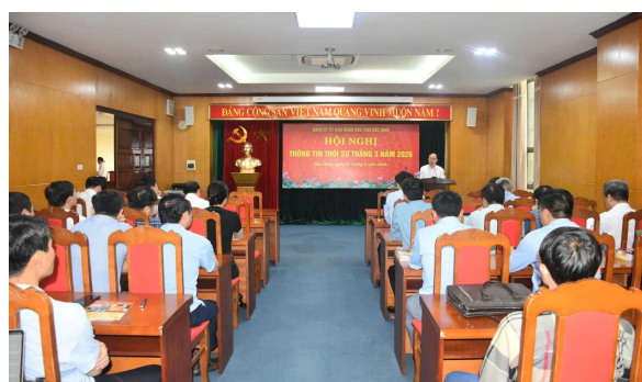
Hội nghị thông tin thời sự tháng 3/2026 của Đảng ủy UBND tỉnh

Lãnh đạo ban hành Chương trình hành động thực hiện Nghị quyết Đại hội đại biểu toàn quốc lần thứ XIV của Đảng, Nghị quyết Đại hội đại biểu Đảng bộ tỉnh Bắc Ninh lần thứ I,