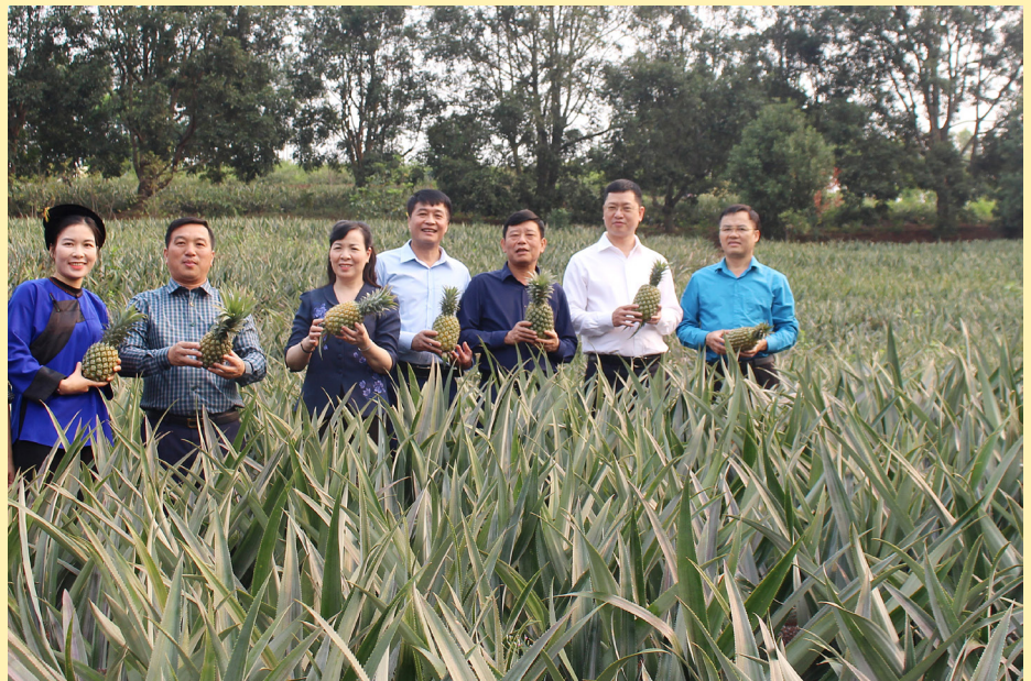
Đồng chí Ngô Tân Phương, Tỉnh ủy viên, Ủy viên BTV Đảng ủy, Phó Chủ tịch UBND tỉnh cùng đoàn công tác của tỉnh thăm mô hình trồng dứa của Hợp tác xã Dứa sạch Hương Sơn.